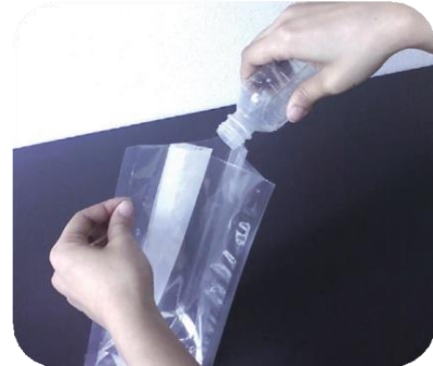
袋に検体と希釈水を入れます