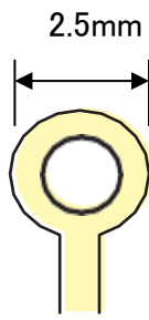
1マイクロリットル 色:イエロー