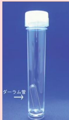
ダースラム管もプラスチック製でまとめて廃棄可能

BGLB、LB、EC培地などの調整 (乳業、食肉加工企業などダースラム管を使用されるお客様へ)