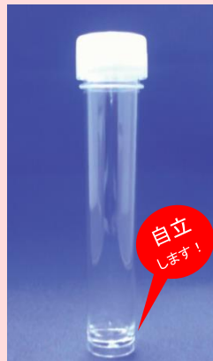
様々な用途に使用可能