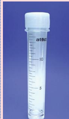
目盛りを目安に分注出来る便利